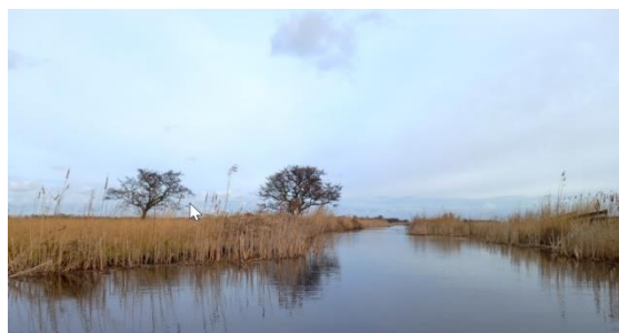
Enkele bomen en veel riet

https://www.natuurmonumenten.nl/natuurgebieden/nieuwkoopse-plassen/route/rode-elektoroute-op-de-nieuwkoopse-plassen-bij-noorden