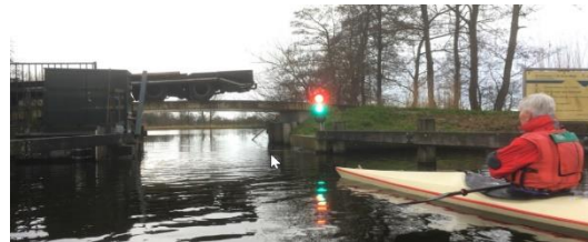
Bedienbare stuw op de Meije

Stuwen: In het gebied zijn er een paar bedienbare klepstuwen. Deze zijn met het symbooltje van een bedienbare sluis op de kaart aangegeven. Met een druk op de knop gaan deze open. Je hoeft dus niet over te dragen.