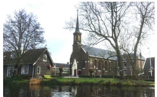
Dorpskerk van Meije