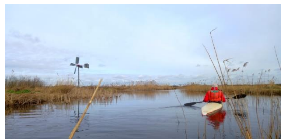
Op de Meesloot tussen het riet

De rode en gele elektroroutes zijn uitgezet voor een elektroboot (die je kunt huren bij het startpunt), maar kunnen ook prima met een kano of kajak gevaren worden.