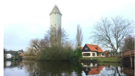
Watertoren van Meije

Ga nu rechtsaf tot aan de Werkschuur waar je begonnen bent.