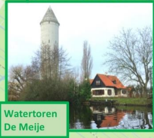
Watertoren De Meije