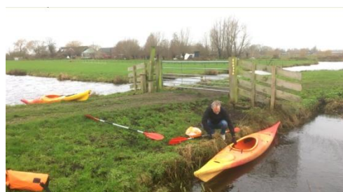
Overdragen achter Amstelkade