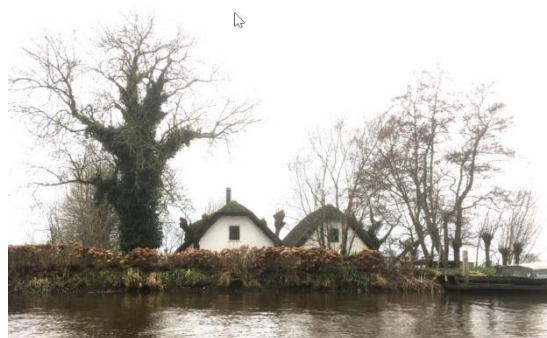
Huisjes achter de dijk van de Kromme Mijdrecht

Alternatieve Start: De route kan ook begonnen worden bij het Toeristisch Overstappunt (TOP) Pondschoekersluis, bij punt 6 op de kaart. Hier is een parkeerplaats en een kanosteiger.