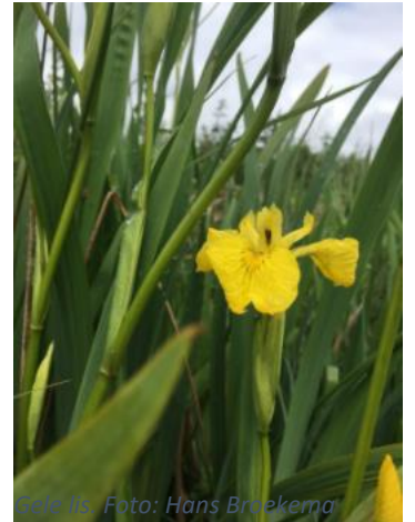
Gele lis.

De sloten op de Zoddenroute zijn versierd met bloemen, de laatste pinksterbloemen worden overwoekerd met scherpe boterbloem, kale jonkers, hondsdraf en de wikke kondigt zich aan. Soms is de waterkant gevuld met de gele lis. In de weide zie je de echte koekoeksbloemen, soms ook de dagkoekoeksbloemen met de bolvormige kelk, de gele raapzaad en de weidevogels. Op een enkele plek is een groot aantal kievieten. Ook zien we laagvliegende zwaluwen en zelfs veel gierzwaluwen. Bij de eendenkooi werden we vergezeld door de zwarte stern, die hun nesten hadden aan de andere kant van het pad. Dat vertelde de boswachter die we daar tegen kwamen. Van de watervogels zagen we voornamelijk de wilde eenden. Door de kou en de sterke wind waren de rietvogels zelden te zien en te horen. Wel hoorde ik hier voor het eerst de nachtegaal van het moerasbos, de cetti's zanger. De gele plomp bedekte soms de petgaten met hun bladeren.