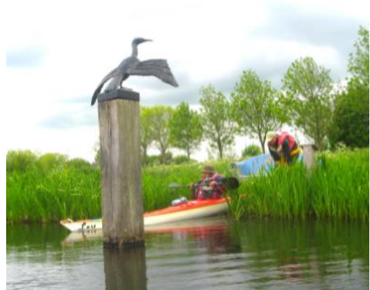
Je schuift zo het water in

Op het fort worden verschillende activiteiten ontplooid. In het weekend kun je hier als bezoeker ook wat eten en drinken. Er zijn plannen om een kanosteiger aan te leggen, maar zover is het nog niet. Je zult nu via de steiger van het trekpontje aan land moeten gaan, of alleen een rondje varen en weer terug.