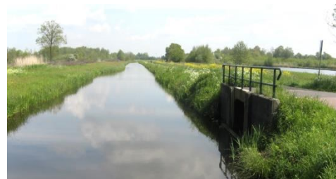
Startpunt Nedereindsevaart. Zoek een stevige

Na een kilometer passeer je 2 bruggen. Hier ga je onder de weg naar Tienhoven door. Ga zelf rechtdoor. Na nog een kilometer kom je weer bij een brug. Dat is punt 2 op de kaart.