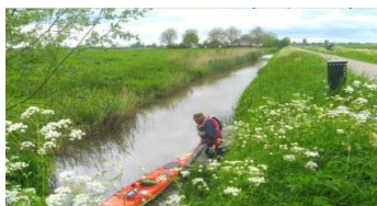
Uitstappen aan het einde van de sloot in de Bethunepolder

8: Een kilometer verderop is een jachthaven aan je rechterhand. Iets voorbij de jachthaven is een 'kanosteiger' aan je linkerhand. Een steiger is daar niet te zien, maar het is een in- en uitstapplaats voor kano's. Ga hier het water uit. Loop een stukje terug over de weg, en ga dan rechtsaf over de Veenkade de Bethunepolder in. Na zo'n 100 meter is een kanosteiger aan je rechterhand. Ga hier het water in.