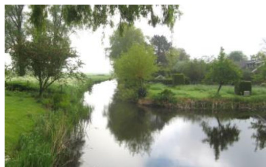
Punt 2: hier gaan we rechtdoor

Aan het einde van de Nedereindsevaart moet je hier aan de rechterkant het water uit. Steek de weg over, en ga aan de andere kant van de weg het Tienhovensch Kanaal in.