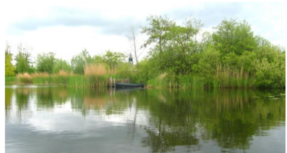
Tienhovense Plas, met op de achtergrond het kerkje van Tienhoven

Als je Tienhoven tot aan de kerk invaart, dan heb je een heel klein stukje verder aan je rechterhand eetcafé Het Olde Regthuys, een gastvrij horecabedrijf sinds 1657. Aanlegkade voor de deur.