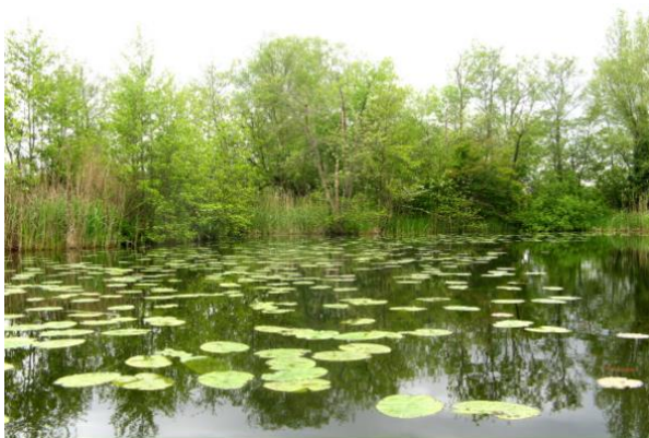
Op de Maarsseveense Zodden

Terug naar de Maarsseveense Zodden. Hier en daar zijn smalle doorgangen voor kanovaarders naar het volgende deel van het plassengebied. Je moet zelf je weg zien te vinden. Mijn tip: blijf in het begin zoveel mogelijk rechts. Als je te vroeg naar links gaat, moet je toch weer helemaal terug naar rechts omdat daar de enige doorgang is.