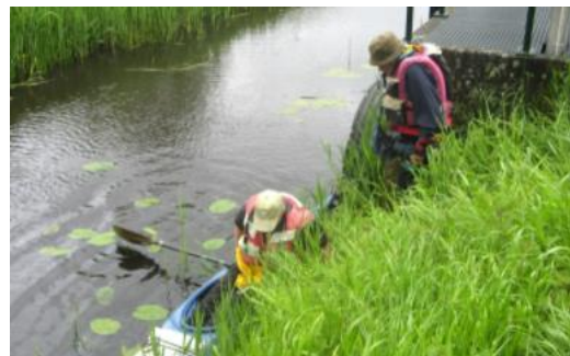
Steile oever van het Tienhovensch kanaal, maar instappen is gelukt zonder natte voeten.

Na de Eendekooi is weer een open gebied, met schapen, koeien en paarden in de wei.