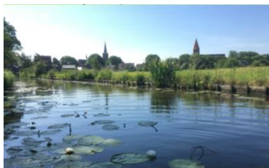
Aan het einde van de Montfoortse vaart heb je mooi zicht op de twee kerktorens van Montfoort

4: Vervolg de Hollandsche IJssel tot in Oudewater.