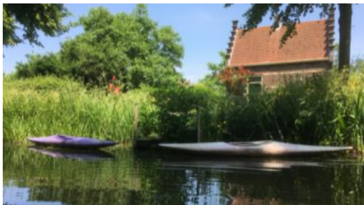
Theetuin de Schapenlaan

Vlak voor het einde van de route, net voor een bocht, kom je langs de mooi gelegen theetuin De Schapenlaan. Als je onder het bruggetje door gaat, dan vind je daar een kleine aanlegsteiger: