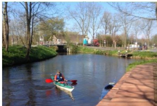
Kanosteiger bij het startpunt, het Toeristisch Overstappunt (TOP) Linschoten: Foto: Hans Broekema

1: Loop vanaf de parkeerplaats (TOP Linschoten, Noord Linschoterdijk 1, 3461 AC Linschoten) over een klein bruggetje en ga dan bij de kanosteiger het water in. Ga linksaf richting Linschoten. Je gaat onder de N204 door, en bent dan in Linschoten. In Linschoten kom je op een driesprong. Ga hier naar rechts de Montfoortse Vaart op.