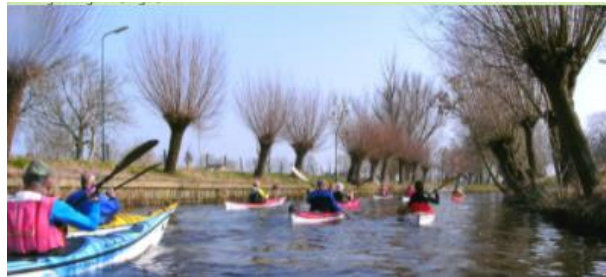
Knotwilgen langs de Lange Linschoten

De Lange Linschoten is een oud riviertje. Vroeger vertrok een wekelijkse veerdienst vanaf Oudewater over de Lange Linschoten naar Amsterdam.