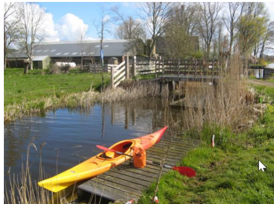
Instappunt bij de Gagelweg

Ga net voor of net na de volgende houten na de vervallen brug naar links. Beide wegen brengen je naar het natuurgebied De Gagel.