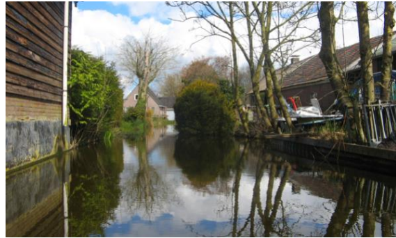
Aankomst in Wilnis