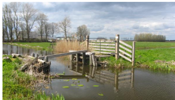
Ernstig vervallen houten brug, langs de Gagelweg