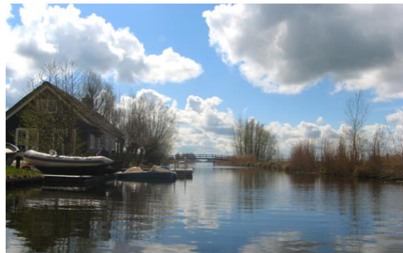
Bijleveld vanaf Wilnis