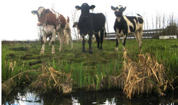
Onderweg kwam ik deze nieuwsgierige kalfjes tegen.