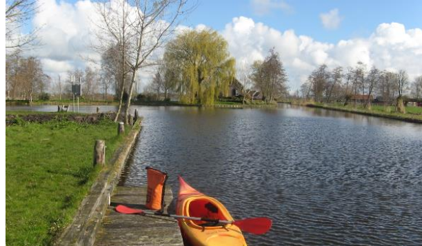
Startpunt bij TOP Heinoomsvaart

Na een paar honderd meter zie je links een kanosteiger. Ga hier het water uit.