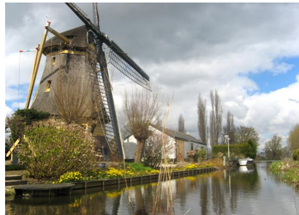
Veenmolen uit 1823