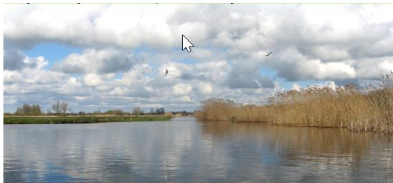
Natuurgebied de Gagel

In de korte documentaire van RTV Utrecht wordt uitgelegd hoe de legakkers zijn ontstaan en hoe ze nu behouden worden. In het kort: het veen werd onder water uitgegraven en op de eilandjes (de legakkers) te drogen gelegd. Hiervan werden turven gestoken, die gebruikt werden als brandstof.