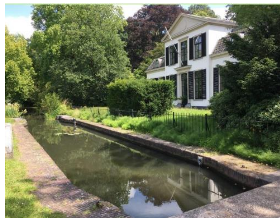
Sluishoef – Buitenplaats Sandwijck, De Bilt

Een paar honderd meter verder vaar je opnieuw over een drijvende balk heen en moet je onder een laag bruggetje. Met een kajak waar je in kunt liggen kun je er wel onderdoor.