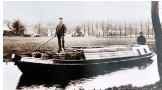
Vrachtvervoer over het water tussen Zeist en Amsterdam - begin 20e eeuw

Tip: Neem een snoeischaar mee om overhangende braamstengels weg te kunnen knippen (als jouw voorganger dat niet recent gedaan heeft) bij de eerste lage brug in Zeist, als je zonder kleerscheuren wilt passeren.