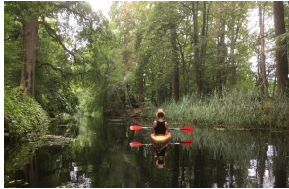
Zeister Grift - Landgoed Oostbroek

Ik ben benieuwd naar ervaringen met deze route! Reacties kun je sturen naar peter@kanokaartutrecht.nl