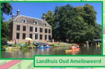
Landhuis Oud Amelisweerd