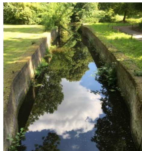
Koppelsluis - Zeist