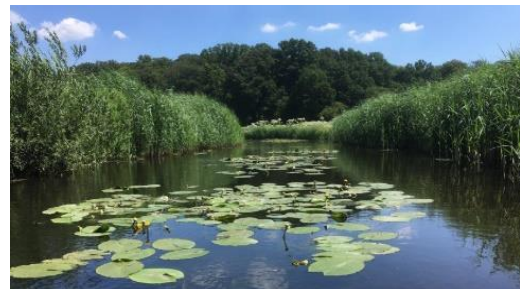
Biltse Grift tussen Utrecht en De Bilt

3: Ga verder over de Biltse Grift. Deze gaat langs een drukke weg en gaat onder de snelweg door. Bij een bruggetje ligt een balk over het water, waar je overheen kunt varen. Vaar zo hard mogelijk, dan hobbel je er zo overheen (en trek je skeg op, als je die hebt). Buiten de stad gekomen bevind je je alleen nog maar in de natuur, met veel waterlelies en gele plomp.